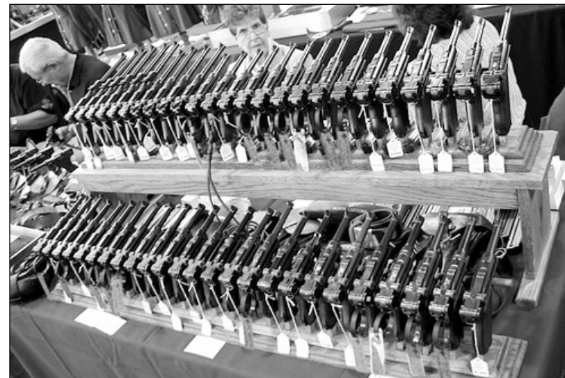
В этой уникальной коллекции пистолетов "Люгер" одинаковых нет. Все они имеют различные клейма, годы выпуска и типы серий, а также владельцев. Наградные и именные пистолеты стоят сотни тысяч долларов