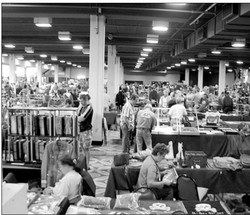
На фото - Восточное крыло павильона Expo Mart, где проходило Max Show. Пятница - очень занятый день. Ведется тщательная подготовка к субботе - дню, когда Max Show посещает самое большое количество посетителей. Поэтому подготовка столов и стенов отнимает много времени и сил.