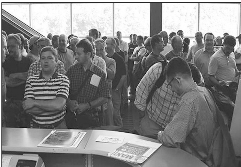
Очередь посетителей в ожидании открытия дверей. Именно в эти минуты много раздумий в ожидании желанных находок. Кто не успел, тот опоздал. Очередь занимает за несколько часов до открытия дверей.