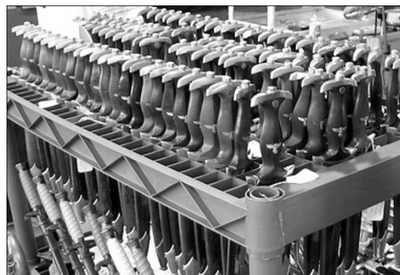
Коллекция кортиков Третьего Рейха штурмовиков СА по типам клинков, коду производителя, типу и году выпуска - широкий выбор для покупателя. Цены от $575 за рядовой, $1000-1500 средний, $3000-5000 высокий уровень редкости.