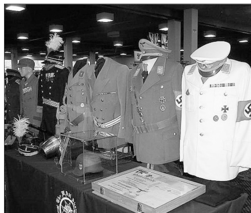
Военные формы генералитета периода Второй Мировой войны: командный состав СССР (Маршал Рокоссовский), Япония (генерал), Италия, Германия, Третий Рейх (высшие чины СД, Люфтваффе, дипломатический корпус, партийный аппарат). Цены конфиденциальные (экспертная оценка десятки тысяч долларов)