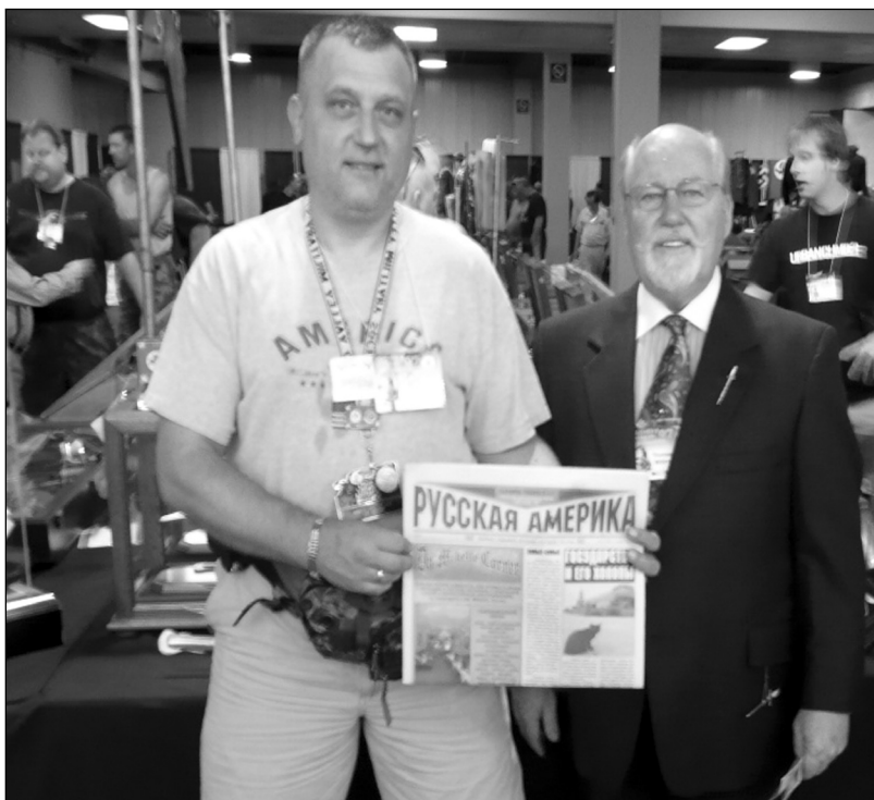
Газета "Русская Америка" пользовалась большим успехом на шоу среди его русскоязычных участников.