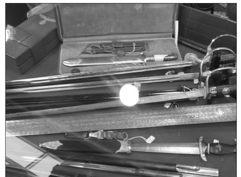
В бронированном кейсе из титана представлена уникальная коллекция наградного оружия Германии эпохи Третьего Рейха. Меч, приписанный Гитлеру от мастеров города Золинген цены не имеет.