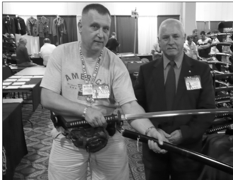
Японское холодное оружие очень ценится коллекционерами. На фото: самурайский меч типа КАТАНА, 17 век. Цена 18000 долларов.