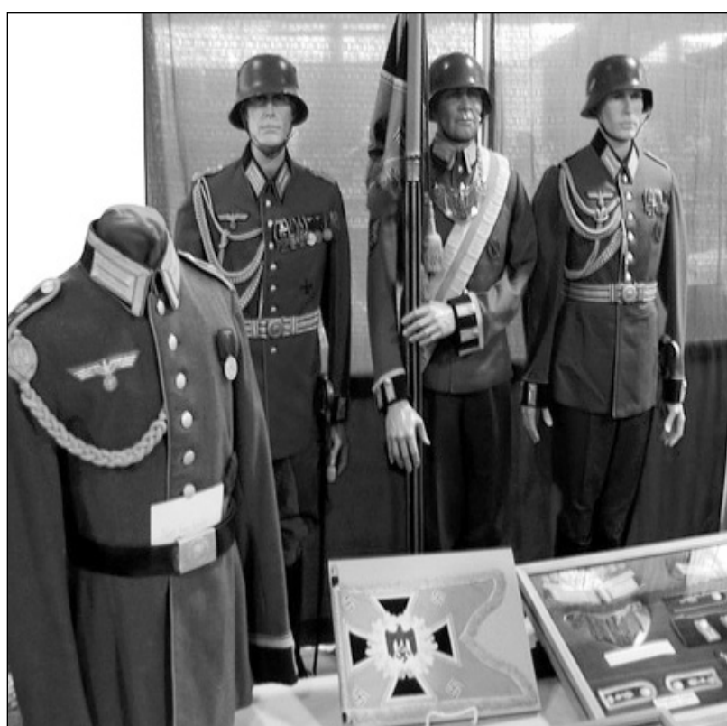
Редкие оригинальные военные формы, представленные на манекенах были вывезены как трофеи из побежденной нацистской Германии