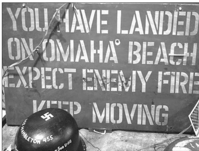
Историческая реликвия: высадка десанта армии США в Нормандии в 1944 году - Омаха-бич