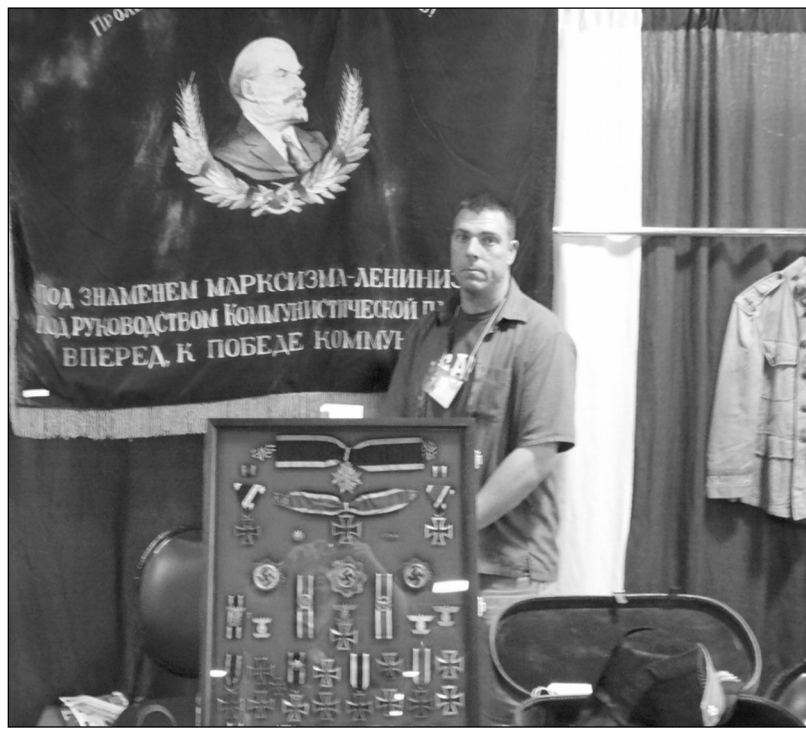
На фото: Выставлено на продажу переходное знамя СССР периода 1970-х годов. Цена $1500

По вопросам статьи пишите автору: General Serge Tsapenko PO Box 4383, Greenville, DE 19807 USA