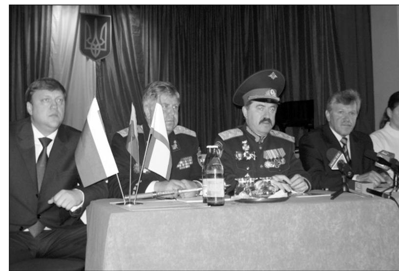
Верховный Атаман СКВРиЗ В.П. Водолацкий проводит Казачий круг на Украине

В наступившем году мы должны завершить интеграцию всех казачьих организаций России, ближнего и дальнего зарубежья - сейчас СКВРиЗ охватывает около 80% таких организа-