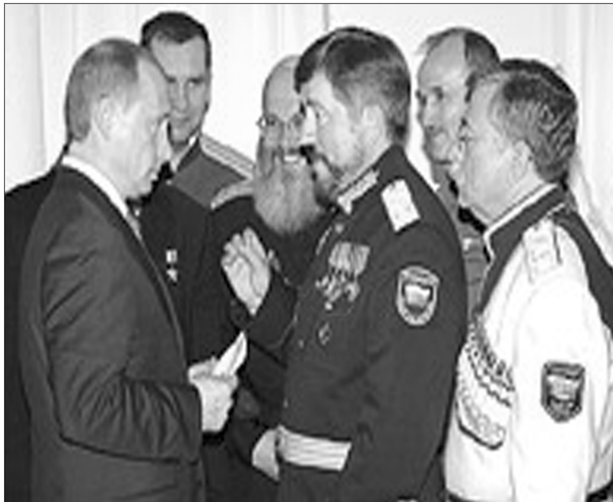
Встреча Президента России В.В. Путина с Верховным Атаманом СКВРиЗ В.П. Водолацкого и атаманов казачьих войск.

Как мы действовали? В мае 2006 года в Крым на Международный казачий форум съехалось 5 тыс. казаков, которые представляли все казачьи войска России от Камчатки до Калининграда, а также ближнего и дальнего зарубежья. Мы провели крестный ход, открыли памятник Андрею Первозванному в Феодосии и мемориальную доску генералу Деникину. Успели даже восстановить памятники, разрушенные сепаратистами на территории Крыма. Состоялся масштабный концерт нашей казачьей культуры, который продолжался почти всю ночь и собравший на площади весь город. Организовать эту мирную акцию было весьма не-