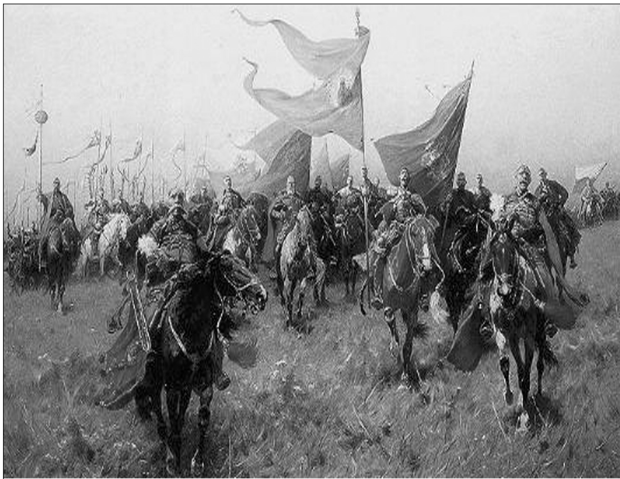
Казаки идут на войну

Язык был славянский, а жили сперва близ Меотийского озера, которое ныне называется Мертвым морем, в какое Дон река впадает (ныне Азовское); эти козары были от племени Гомера, первого сына Иафета, и от гомерра прежде нарицались гомерры. А от греков Кимерры: от римлян же Цымбры, которые по полуденным странам (северным) рассеялись и различные проименования себе присвоили. Которые ливою, которые жмудью, а иные наречены готами. Тогда от реки Козара именуемой, тоже племя Гоморова наречше-