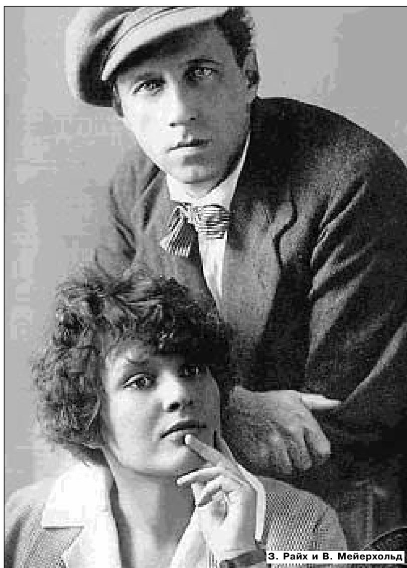
З. Райх и В. Мейерхольд

Бомонд относился к ней холодно, считал посредственной, обвинял в чрезмерном давлении на мужа в профессиональном плане. И, тем не менее, только истинным чувством можно объяснить решение Всеволода Эмильевича включить в репертуарный план театра французскую, любовную мелодраму Дюма-сына «Дама с камелиями». Свой последний спектакль мастер ставил исключительно